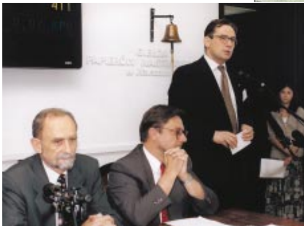
30.06.1997 r. debiut akcji Banku Handlowego na warszawskiej giełdzie

Zmniejszenie portfela restrukturyzacyjnego było wynikiem m.in. sprzedaży akcji Stoczni Gdynia SA Stoczniewemu Funduszowi SA. Dokonano także sprzedaży akcji z portfela zaangażowań aktywnych. Jedną z najważniejszych transakcji była sprzedaż - po blisko dwuletnim okresie posiadania - pakietu akcji ZML Kęty.