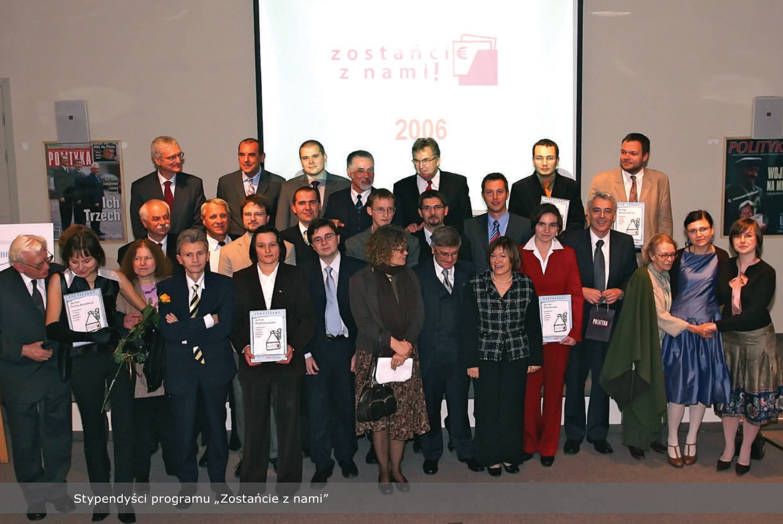
Stypendyści programu „Zostańcie z nami”