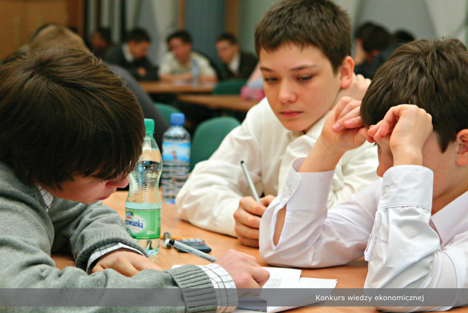
Konkurs wiedzy ekonomicznej

Ponadto, w nakładzie 270.000 szt. został także wydany specjalny notes finansowy, który służy wszystkim uczniom biorącym udział w programie jako narzędzie planowania osobistego budżetu na podstawie wiedzy zdobytej podczas lekcji „Moich Finansów”.