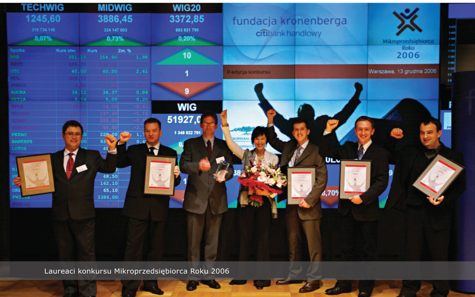
Laureaci konkursu Mikroprzedsiębiorca Roku 2006