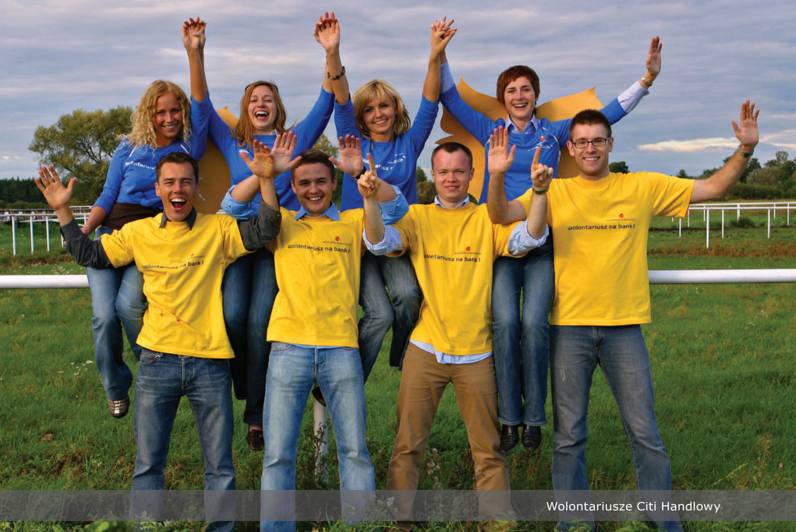
Wolontariusze Citi Handlowy