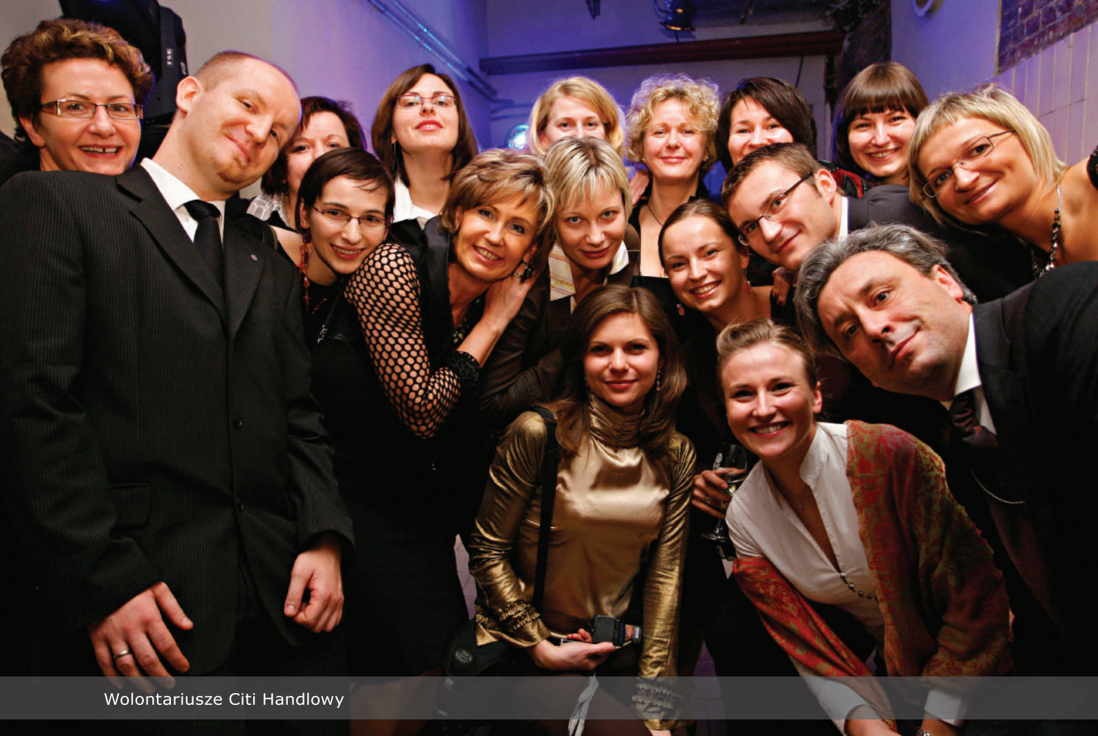
Wolontariusze Citi Handlowy