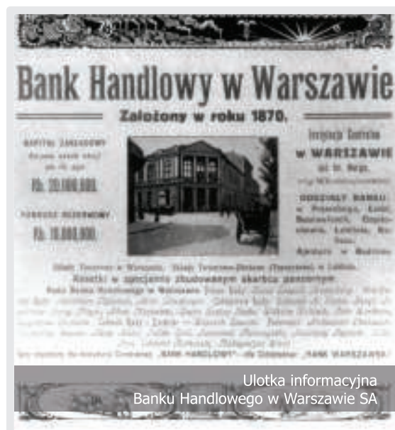
Ulotka informacyjna Banku Handlowego w Warszawie SA

1870 r. otwarcie Banku Handlowego w Warszawie