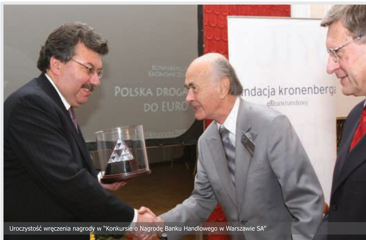
Uroczystość wręczenia nagrody w "Konkursie o Nagrodę Banku Handlowego w Warszawie SA"