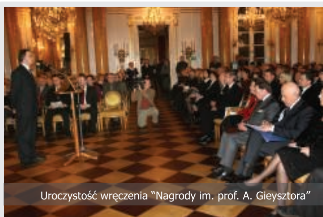
Uroczystość wręczenia "Nagrody im. prof. A. Gieysztor"

Uroczystość wręczenia nagrody odbyła się 9 lutego 2006 r. na Zamku Królewskim w Warszawie. Podczas uroczystości zaprezentowany został film o laureacie wyprodukowany przez Fundację specjalnie na tę okazję.