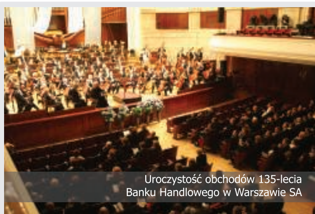
Uroczystość obchodów 135-lecia Banku Handlowego w Warszawie SA

Bank Handlowy w Warszawie SA 135 lat tradycji 1870-2005