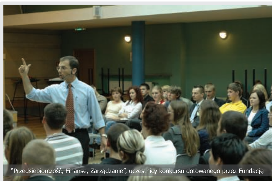
"Przedsiębiorczość, Finanse, Zarządzanie", uczestnicy konkursu dotowanego przez Fundację

Niezwykle ważna dla znalezienia właściwego rozwiązania w sytuacjach problemowych, związanych z rozliczeniem dotacji, jest ścisła współpraca z Komisją Rewizyjną, zwłaszcza jej pomoc prawna i formalno-księgową dotycząca postępowania w przypadkach budzących wątpliwości.