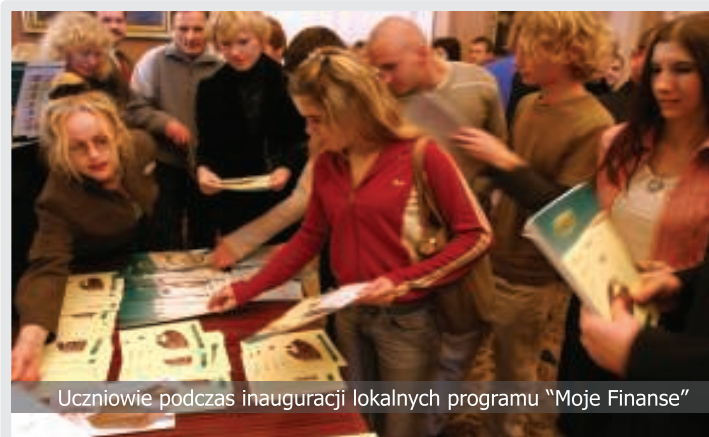
Uczniowie podczas inauguracji lokalnych programu "Moje Finanse"

Nowatorskie materiały edukacyjne konsultowane przez ekspertów z Citibank Handlowy