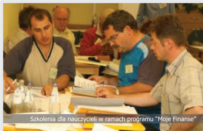
Szkolenia dla nauczycieli w ramach programu "Moje Finanse"

W październiku i listopadzie program "Moje Finanse" został zaprezentowany szerokiej publiczności podczas czterech inauguracji regionalnych w Gdańsku, Krakowie, Poznaniu i Lublinie. W Krakowie uczestników inauguracji gościło Muzeum Uniwersytetu Jagiellońskiego. W historycznych salach Collegium Maius przedstawiciele władz lokalnych, nauczyciele i uczniowie zapoznali się z założeniami programu i dowiedzieli się, jak będzie wdrażany w Małopolsce. Cykl spotkań regionalnych zakończyliśmy w Lublinie 7 listopada 2005 r. W spotkaniu uczestniczyło ponad 70 uczniów, nauczycieli i przedstawicieli instytucji samorządowych. Po części oficjalnej odbyły się rozmowy kulturalowe z przedstawicielami władz oświatowych na temat potrzeby wsparcia i akceptacji działań szkół realizujących program.