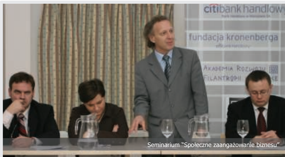
Seminarium "Społeczne zaangażowanie biznesu"

W ramach programu, którego celem jest zapoznanie przedsiębiorców z nowoczesnym modelem filantropii, rozumianym jako partnerstwo firm i organizacji społecznych, w roku 2005 odbyły się w czterech miastach seminaria pt.: Społeczne zaangażowanie biznesu - marketing, public relations, a może inwestycja...?, w których wzięło udział ponad 250 przedsiębiorców: klientów lokalnych oddziałów Citibank Handlowy, przedstawiciele samorządów, organizacji pozarządowych i mediów lokalnych.