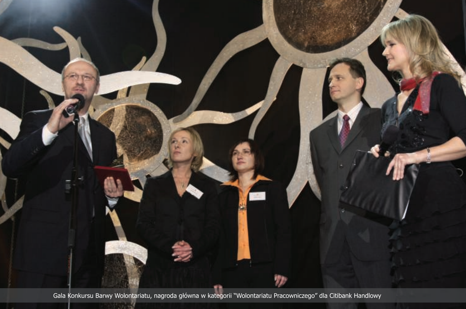
Gala Konkursu Barwy Wolontariatu, nagroda główna w kategorii "Wolontariatu Pracowniczego" dla Citibank Handlowy