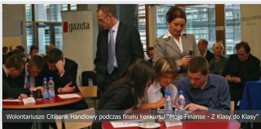
Wolontariusze Citibank Handlowy podczas finału konkursu „Moje Finanse - Z Klasy do Klasy”

Program „Moje Finanse” wraz z komponentem wolontariatu pracowniczego wpisuje się w długofalową strategię społecznego zaangażowania Citibank Handlowy. Realizacja ogólnopolskiego programu edukacji ekonomicznej we współpracy z instytucją publiczną i profesjonalną organizacją pozarządową buduje wizerunek banku jako instytucji odpowiedzialnej społecznie oraz jako korporacyjnego lidera w działaniach na rzecz dobra publicznego, w szczególności w zakresie edukacji finansowej i promocji przedsiębiorczości.