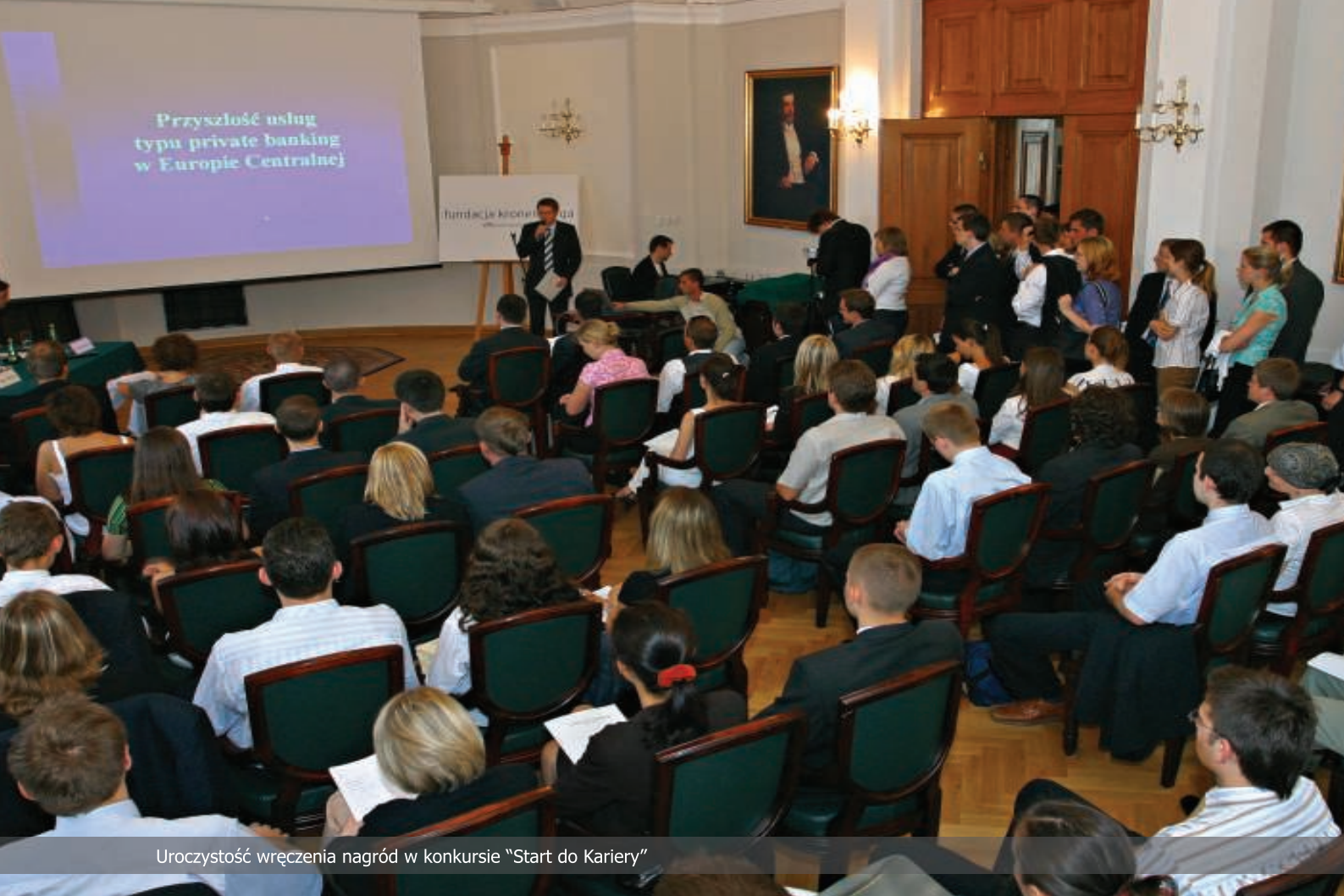
Uroczystość wręczenia nagród w konkursie "Start do Kariery"