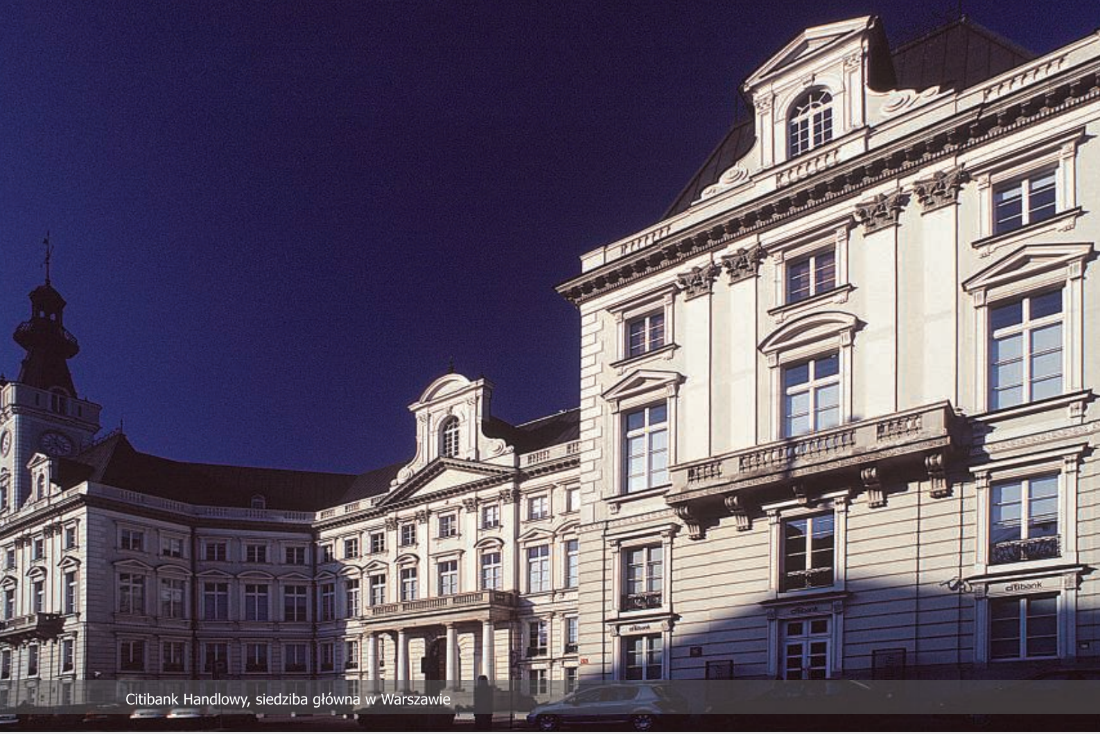
Citibank Handlowy, siedziba główna w Warszawie