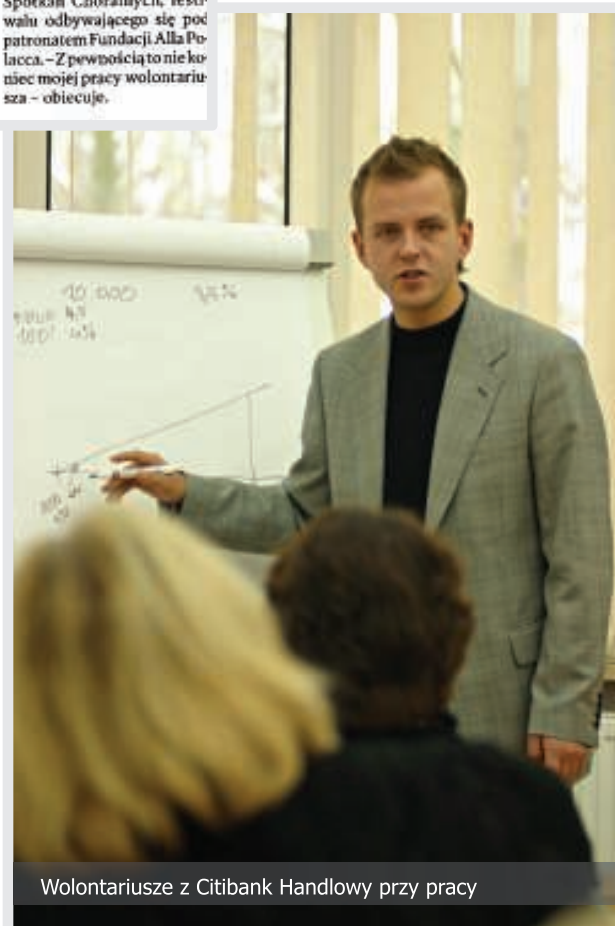
Wolontariusze z Citibank Handlowy przy pracy

„Program Wolontariatu Pracowniczego w Citibank Handlowym” został uhonorowany główną nagrodą V edycji konkursu Barwy Wolontariatu w kategorii „Wolontariat Pracowniczy”.