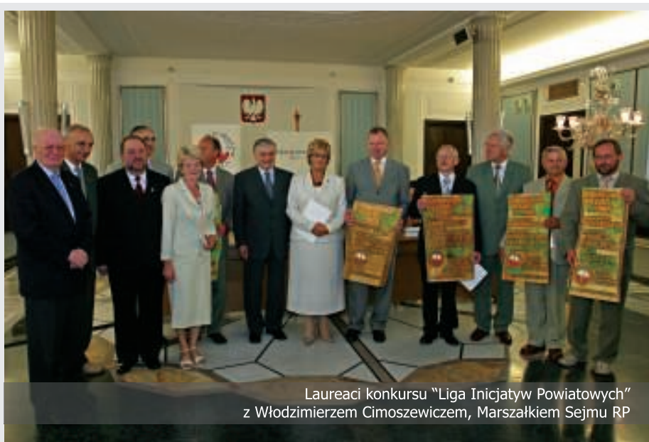
Laureaci konkursu "Liga Inicjatyw Powiatowych" z Włodzimierzem Cimoszewiczem, Marszałkiem Sejmu RP

Konkurs organizowany przez Fundację Kronenberga oraz Związek Powiatów Polskich. Jego celem było inspirowanie działaczy samorządowych i społecznych do poszukiwania nowych sposobów rozwiązywania problemów społeczności lokalnych w skali ponadgminnej. Udział w konkursie mogła wziąć każda organizacja lub instytucja, która poprzez realizację swojego pomysłu czynnie włączała się w rozwiązywanie problemów mieszkańców powiatów.