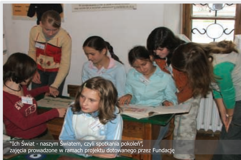
"Ich Świat - naszym Światem, czyli spotkania pokoleń", zajęcia prowadzone w ramach projektu dotowanego przez Fundację

Biuro Fundacji konsekwentnie egzekwowało nadsyłanie merytorycznych sprawozdań i finansowych rozliczeń przyznanych dotacji. W ciągu roku nie nadesłano w terminie 10 rozliczeń dotacji, jednak opóźnienia, monitowane przez biuro Fundacji, nie przekraczały zwykle 14 dni. Ponadto, zgodnie z zaleceniem Komisji Rewizyjnej i decyzją Zarządu Fundacji, kontynuowano procedurę kompleksowych działań kontrolnych dotowanych projektów.