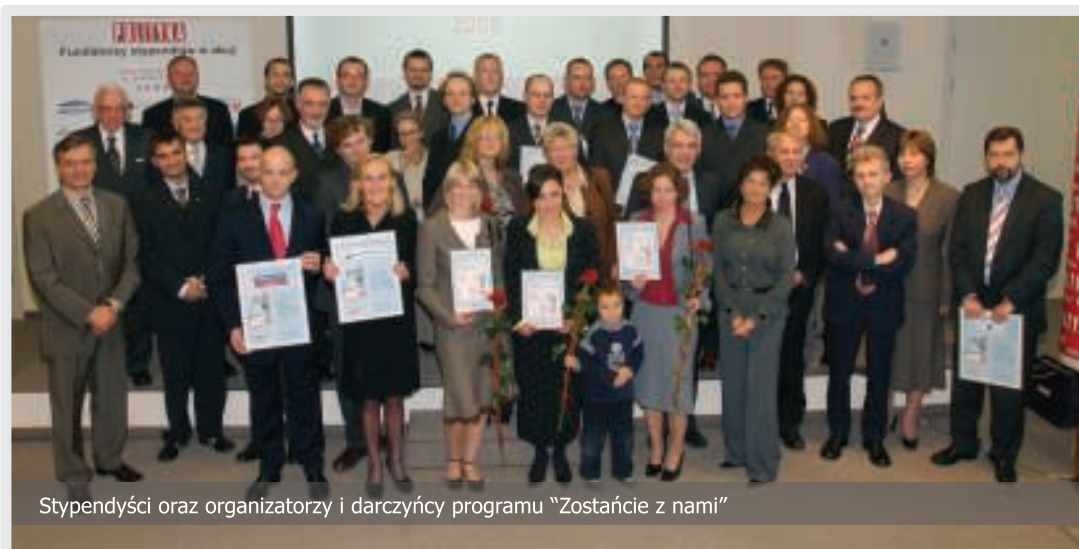
Stypendyści oraz organizatorzy i darczyńcy programu "Zostańcie z nami"

W roku 2005 Fundacja wyasygnowała środki na 2 stypendia po 25.000 zł każde.