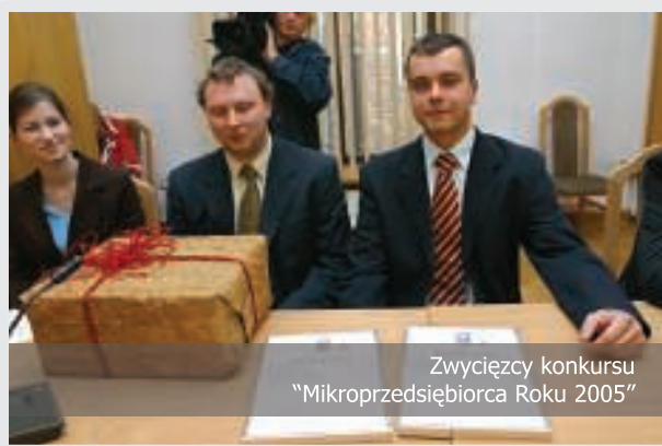
Zwycięzcy konkursu "Mikroprzedsiębiorca Roku 2005"