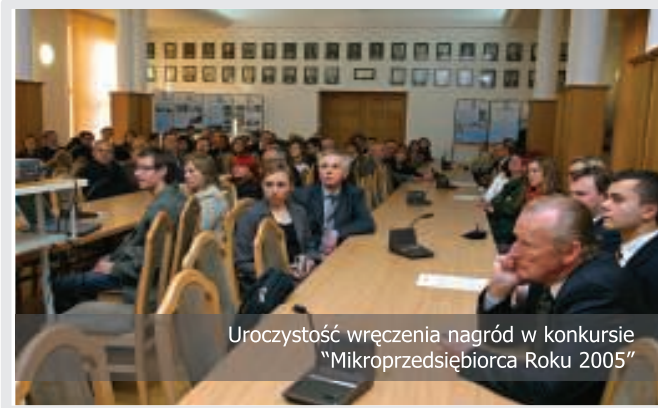
Uroczystość wręczenia nagród w konkursie "Mikroprzedsiębiorca Roku 2005"