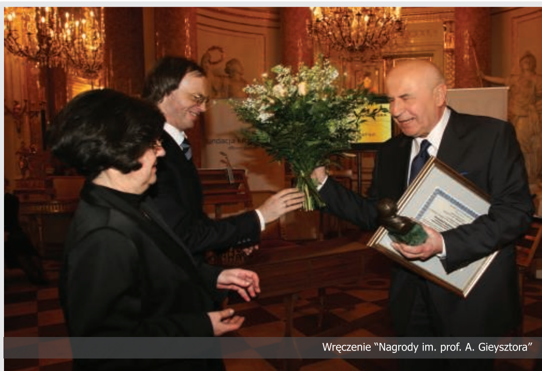
Wręczenie "Nagrody im. prof. A. Gieysztor"

Nagroda za ochronę polskiego dziedzictwa kulturowego