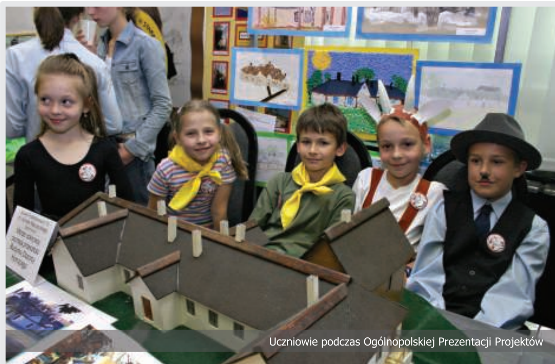
Uczniowie podczas Ogólnopolskiej Prezentacji Projektów

2.000 uczniów opiekuje się lokalnymi zabytkami