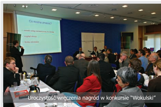
Uroczystość wręczenia nagród w konkursie "Wokulski"

Konkurs prowadzony jest wspólnie z Radiem TOK FM. W trakcie jego trwania, co tydzień, w porannym magazynie ekonomicznym: EKG - Ekonomia, Kapitał, Gospodarka, prowadzonym przez Marka Tejchmana na antenie Radia TOK FM, możemy usłyszeć praktyków oraz teoretyków ekonomii, gospodarki i biznesu, którzy na bieżąco komentują wydarzenia związane z konkursem a także opowiadają o konstrukcji i zasadach pisania biznesplanu.