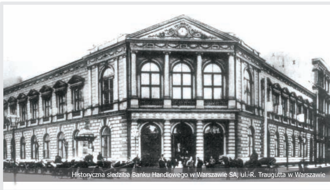
Historyczna siedziba Banku Handlowego w Warszawie SA, ul. R. Traugutta w Warszawie

1875 r. otwarcie Szkoly Handlowej w Warszawie (obecna SGH)